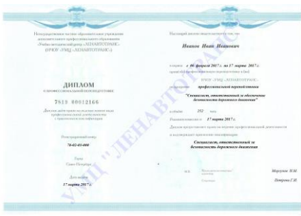
Диплом о профессиональной переподготовке