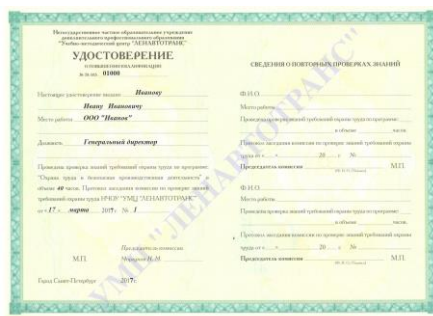
Удостоверение о повышении квалификации