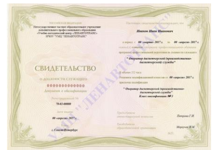
Свидетельство о должности служащего