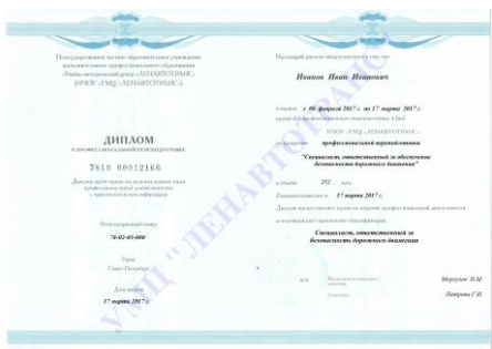
Диплом о профессиональной переподготовке