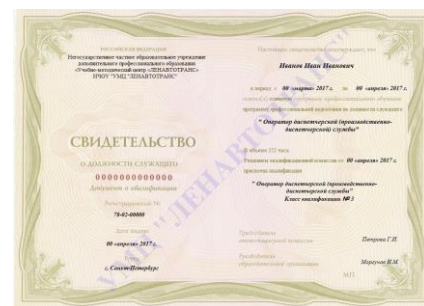
Свидетельство о должности служащего