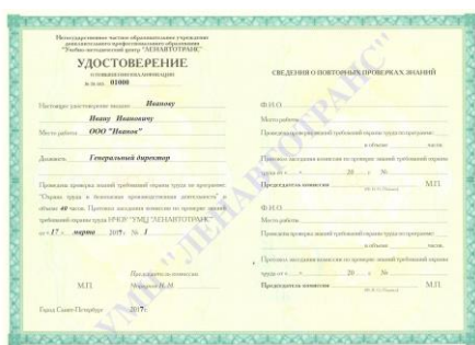
Удостоверение о повышении квалификации